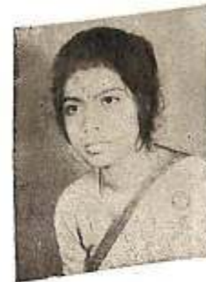
জ্যোতিকা কাকতি শ্ৰেষ্ঠা অভিনেত্ৰী ১৯৮৬-৮৭