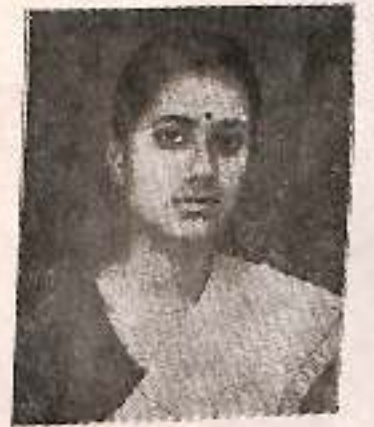
অমিতী ভূঞা শ্রেষ্ঠা গায়িকা (১৯৮৬)