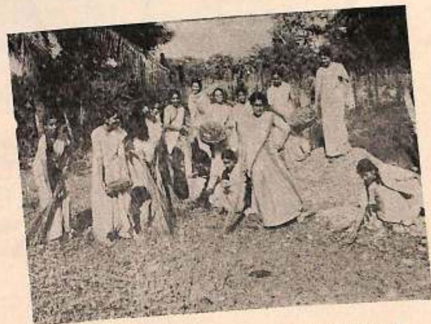
কলেজৰ ছাত্ৰীসকলে কলেজ চৌহদত সমাজ উন্নয়নমূলক কাম কৰাৰ দৃশ্য ॥